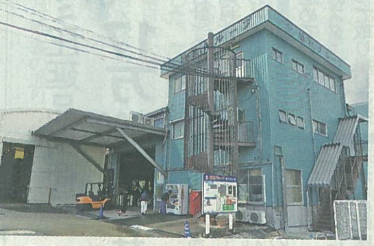
経営体質を強化する植松本社

静岡地区大手鉄鋼二 三次製品特約店の植松 (本社・静岡県沼津市、 沼津、富士、御殿場、 伊東の静岡県内の4営 業所を、このほど本社 に統合した。薄板金属 建材の成形加工拠点で ある本社工場との製販 一体化で、製品在庫管