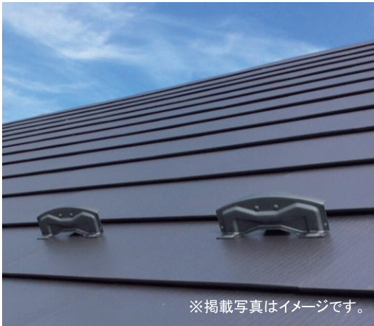
※掲載写真はイメージです。